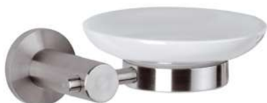
IMMAGINE - IMAGE